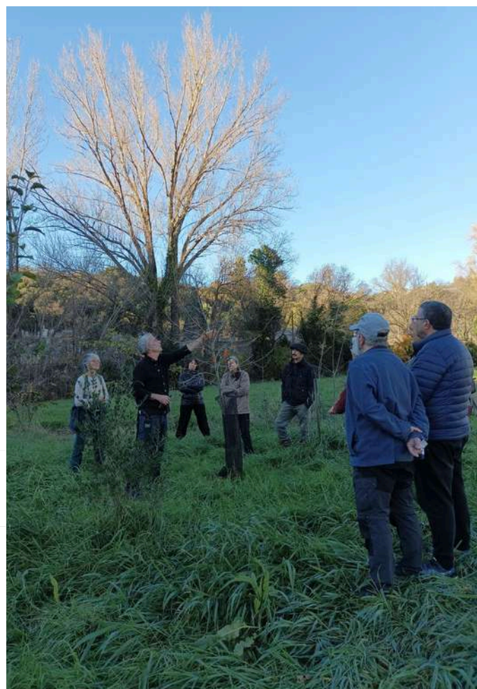
Atelier taille de formation au verger de la Lergue - 27 Nov. 2024

Les arbres ont une belle pousse et les premières fruits sont apparus! Des petits chantiers réguliers, ouverts à toutes et tous, sont organisés par l'association pour entretenir les arbres. Une convention a été signée avec la Ville de Lodève propriétaire du terrain et nous créons un partenariat avec les services GEMAPI qui sont gestionnaires de la parcelle (proche de la Lergue). Historique : Fin 2020, le service eau de la Communauté de Communes du Lodévois Larzac bénéficie d'un reste de budget à allouer à l'aménagement des berges avant 2021. Il propose à l'association Paysarbre de le dédier à une plantation d'arbres fruitiers sur la parcelle en bord de Lergue. L'association accepte, rêvant toujours de fruits accessibles à toutes et tous, et les plantations sont lancées. Entre Janvier et Avril 2021, c'est 63 arbres fruitiers de 42 essences différentes, ainsi que 227 arbres champêtres de 25 essences différentes qui ont été plantés et 75 m 2 de broyat pour pailler le tout !