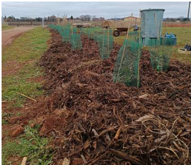
Haie plantée et paillée dans le cadre du programme Hérault'Haies - Février 2025

Programme national historique de la Fédération de Chasse pour inciter les communes à planter de la haie champêtre, Paysarbre s'y inscrit activement en 2024 grâce au partenariat avec la fédération de l'Hérault. L'objectif est d'apporter un soutien technique pour des plantations réussies et pérennes, notamment via une expertise spécifique au contexte méditerranéen. Cette année, nous avons ainsi accompagné la plantation de 650 mètres de haies champêtres avec les communes et la Fédération de Chasse de l'Hérault.